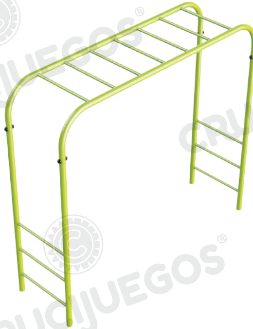
Imagen referencial. Para más información ingrese a www.insumos.crucijuegos.com